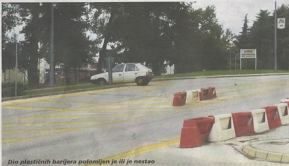
Dio plastičnih barijera polomljen je ili je nestao

"Ukoliko Grad Poreč prihvati rekonstrukciju uređenja raskrižja s kontinuiranim prometnim tokom u smjeru sadašnje državne ceste, s obaveznim desnim ulazno-izlaznim rampama, HC će raskrižje rekonstruirati iduće godine. Ukoliko Grad Poreč ne prihvati ponudeno tehničko rješenje, HC odustat će od planirane rekonstrukcije raskrižja", stoji u zaključku odgovora koji smo primili iz HC-a.