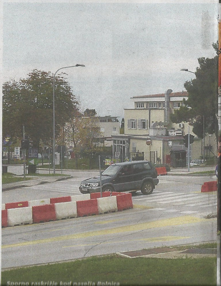
Sporno raskrižje kod naselja Bolnica

Na problem su upozoravali i gradski vijećnici na aktualnom satu, a potpisnici peticije pak navode da "s obzirom da je tijekom turističke sezone promet bio reguliran putem "privremeno- nog rješenja" te s obzirom