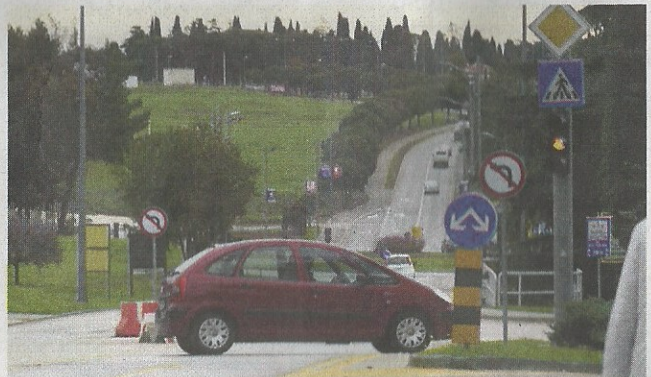
Zbog djelomično uništene barijere vozači voze "po starom"